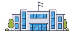
IES del Andévalo (Puebla de Guzmán)