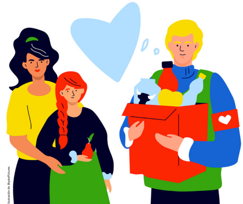
Ilustración de BoydePictures.

Algunos ejemplos para enseñar la necesidad de implicarse en la construcción de un mundo mejor, usando el ApS, pueden ser ayudando en comedores, economatos, campañas de recogida de alimentos, conservación del medio natural, iniciativas sociales y culturales para visibilizar otras realidades, participar en una carrera para recaudar fondos para la investigación del cáncer infantil o el cáncer de mama, compartir una tarde de juegos en una residencia de personas mayores o recoger basura en una excursión a la playa.