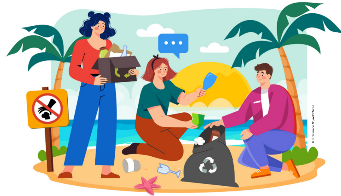
Ilustración de BoykoPictures