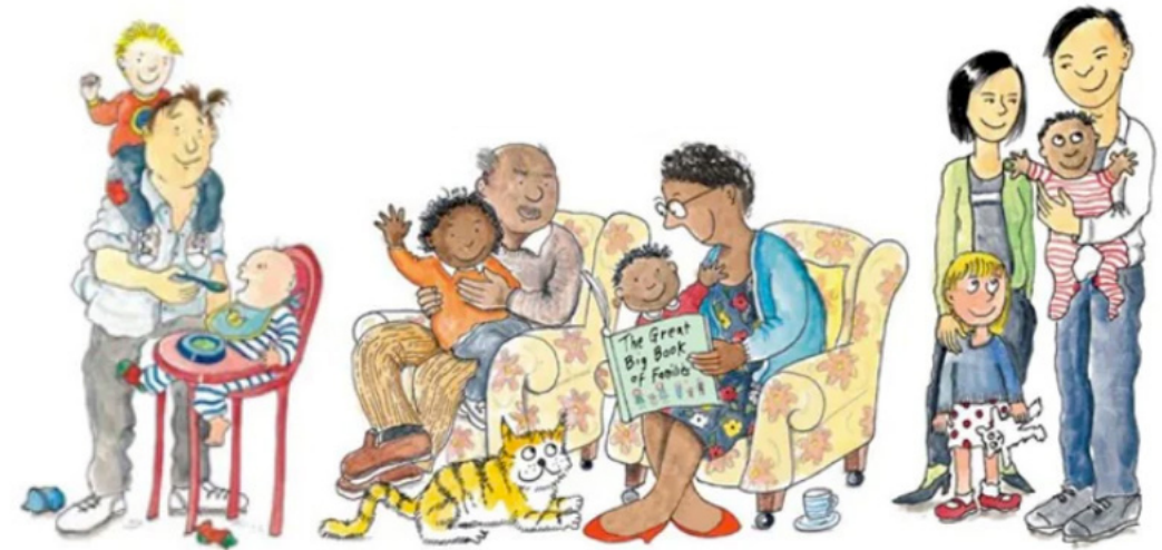
Ilustraciones del libro El gran libro de las familias Ilustraciones de Mary Hoffman y Ros Asquith.

Es por eso que la familia y la escuela deben trabajar mano a mano para conseguir un desarrollo pleno de nuestros niños y nuestras niñas, contribuyendo a su desarrollo personal, social y educativo. Profesorado y familia deben remar de forma sincronizada y en la misma dirección. Lo que se aprende en clase se completa y se aplica en casa con el resto de la familia.