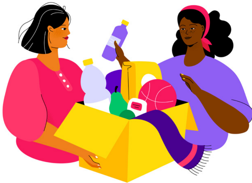
Ilustración de BoykoPictures

El Aprendizaje Servicio no solo ayuda a construir un mundo más justo, sino que también refuerza los lazos familiares . El tiempo de calidad en familia es una oportunidad única para seguir aprendiendo a través del ejemplo y de la interacción entre los miembros de la familia, más allá del espacio formal de la escuela .