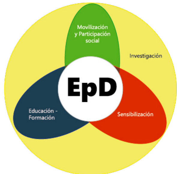
Dimensiones EpD.

El recorregut de l'Àrea d'Educació per al Desenvolupament durant aquests anys ha anat evolucionant i donant resposta a l'elaboració i el disseny de diverses propostes integrals, articulades al voltant de les dimensions reconegudes de l'Educació per al Desenvolupament. Aquestes quatre dimensions conflueixen i s'interrelacionen entre elles, donant sentit a una idea d'EpD com a actuació holística, en la qual s'han de donar elements de cadascuna de les dimensions