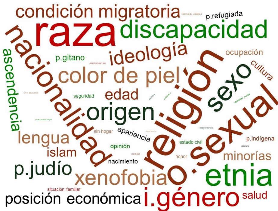
Figura 2: Condiciones Asociadas a Recibir Discursos de Odio

Nota: Nube de palabras de elaboraci3n propia a partir de an3lisis de contenido. El tama1o de cada palabra est3 asociado a la frecuencia con la que el t3rmino aparece en la literatura revisada.